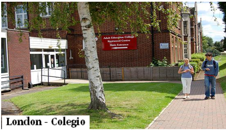
London - Colegio